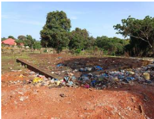
Figura 3 - Alrededores de vertedero del mercado de Hérico Centro

En el momento de la evaluación se constató la presencia de mucha basura alrededor del vertedero, y varias áreas y compartimentos sin uso.