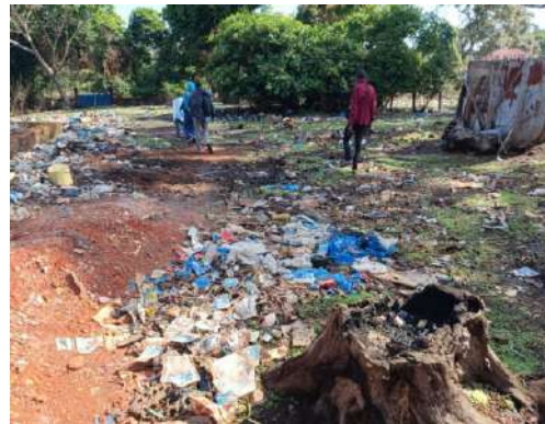
Figura 4 - Alrededores de vertedero del mercado de Hérico Centro

Se ha comprobado igualmente la presencia de algunos residuos sólidos mezclados con señales de quema en el área destinada a la descarga y separación de residuos. Se concluye, pues, que el vertedero puede haber sido diseñado presuponiendo una cantidad de residuos más elevada de la que en realidad se deposita y gestiona.