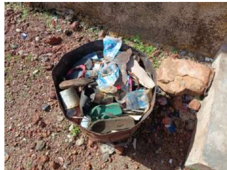
Figura 2 - Papelera en el mercado de Hérico Centro

Por lo que se refiere al vertedero municipal, este consta de un espacio para el almacenamiento de materiales no combustibles y un foso destinado a la incineración de los combustibles, ambos cerrados con puertas metálicas. Al exterior de dichos compartimentos, se encuentra un espacio donde se planeaba realizar la separación de los residuos y también se ha habilitado un área para realizar el compostaje del material orgánico recogido durante la limpieza del entorno del mercado. No ha sido posible dotar de puntos de agua al vertedero, aunque, según consta en el informe final del 3 er año, se ha dotado al comité de utensilios para el transporte de agua (bidones, etc.).