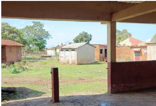
Figura 1 - Letrinas del mercado de Hérico Centro, cerradas