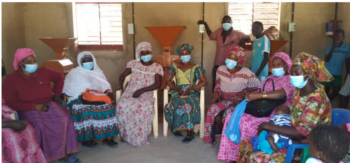
Ilustración 3. Grupo focal de la evaluación- comuna de Sagatta

Un primer efecto de la intervención es que la Red de Mujeres Activistas desde su creación ha ido creciendo favorablemente, articulando y representando a las organizaciones de mujeres de los municipios de Kebemer. Con el proyecto han tenido un rol social protagónico en los procesos de institucionalización de las políticas de atención y prevención de la violencia en el nivel local, con ello, el proyecto contribuye a fortalecer la participación social y política de las mujeres Senegalesas. A mediano plazo estas mujeres pueden llegar a