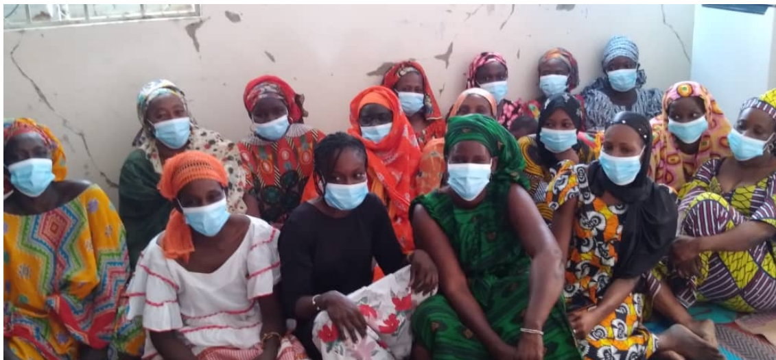
Ilustración 4. Grupo focal de la evaluación final - comuna de Diokoul

El proyecto integró la perspectiva de género de manera transversal en sus tres componentes, desde la formulación, operativa y evaluación. La intervención tiene una fuerte centralidad en promover los derechos de las mujeres, como eje principal alrededor del cual se vertebran y complementan sus tres resultados.