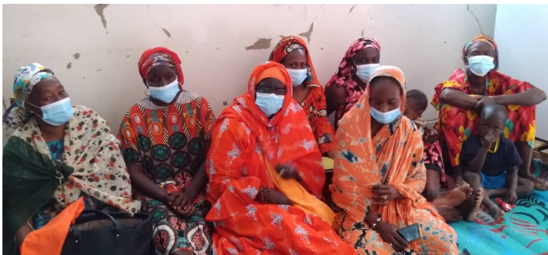
Ilustración 1. Grpo focal de la evaluación- comunidad Diawar ( Ngourane )

El proyecto ha logrado una alta participación en sus diferentes fases de los grupos meta priorizados y los actores institucionales, organizaciones y población de las comunas focalizadas del departamento de Kebemer. En cuanto a la calidad de la participación, en términos generales las acciones desarrolladas han logrado captar la motivación de participación de los grupos meta, de las autoridades de Kebemer, de las instituciones públicas y el liderazgo comunitario , que aportaron ideas, y asumieron compromisos con procesos clave como los impulsados con el Resultado 2, que han fortalecido la institucionalización del marco normativo para la prevención y atención de las violencias de género y otras vulneraciones que afectan a las mujeres del país, sin la participación de todo el conjunto de actores locales hubiera sido imposible sacar adelante el Plan Departamental de Prevención de las violencias basadas en el género. En general, las acciones implementadas han potenciado la participación de las mujeres en espacios de toma de decisiones a nivel departamental, institucionalizándose su reconocimiento como actoras sociales con derechos a opinar y decidir sobre los recursos públicos, procesos que requieren seguirse apoyándose hasta que las mujeres logren un nivel de empoderamiento que garantice esta participación sin ayuda externa.