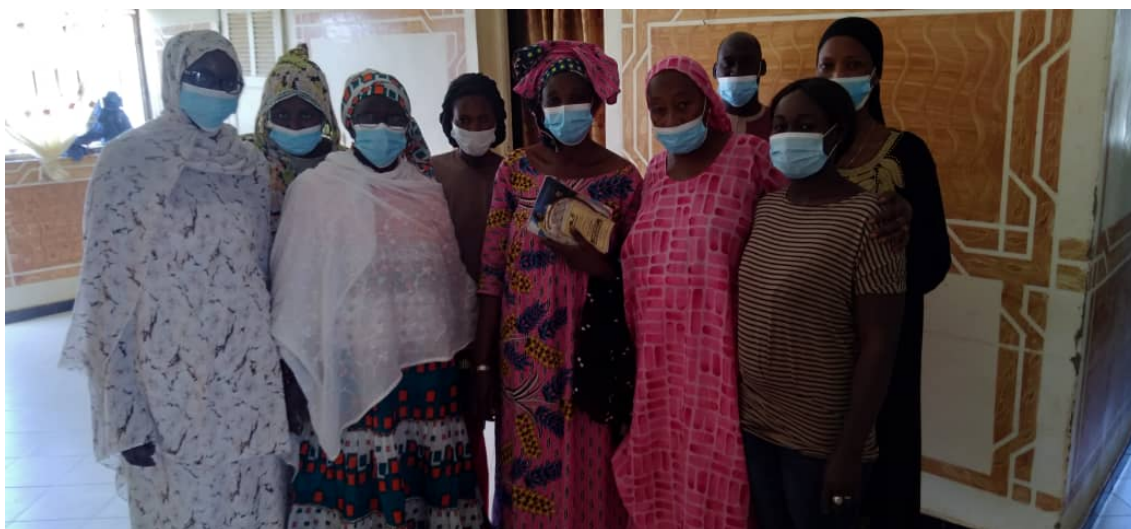
Ilustración 2. Grupo focal de la evaluación- Lideresas

Los procesos que FADEC y NE-SI impulsan en Kebemer son de largo aliento, y la actual intervención da continuidad al proceso de fortalecimiento de las estructuras organizativas locales iniciados en anteriores intervenciones. Es el caso de la Red de Mujeres Activistas de Kébémér (creada en el FOCAD 2016) que tiene la misión de acompañar y defender los derechos sociales, económicos, ambientales y políticos de las mujeres de estos territorios.