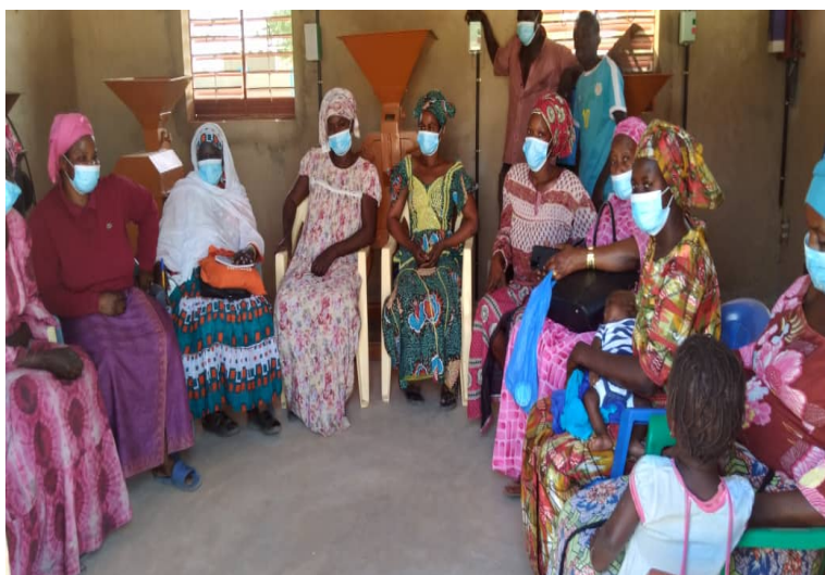
Ilustración 5. Grupo focal de la evaluación final- Comuna de Bandagne

Las acciones planteadas por el proyecto tienen un fuerte enfoque de Derechos, que es su núcleo vertebrador a partir del cual se articulan y complementan sus tres componentes, en un contexto donde históricamente las mujeres han sufrido la vulneración de sus derechos básicos. Según el reporte de Amnistía Internacional 2021, la situación de vulneración de los Derechos Humanos en el país es realmente preocupante.