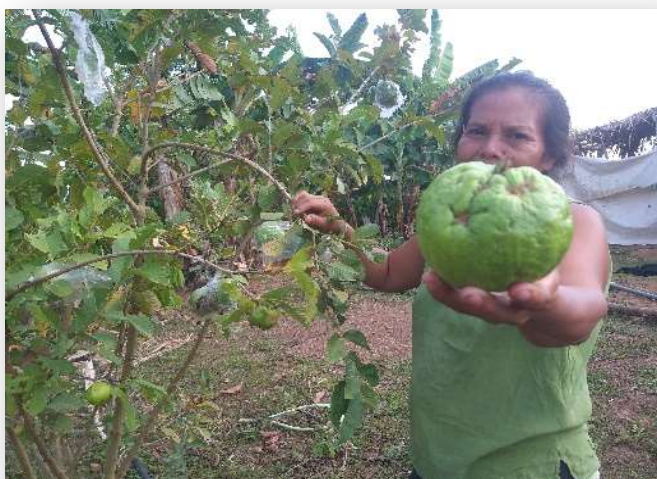
Ilustración 12. Mujer de Moss muestra su producción tras huracanes

Las estructuras comunitarias se han creado y se ha llevado un proceso de capacitación reforzaron el rol de los comités de comercio local, que eran responsables de buscar otras vías alternativas para la venta de la producción comunitaria. Este es uno de los procesos que tuvo retraso porque se buscó que fuera participativo e incluyente, con la participación de representantes de los comités de comercio local de todas las comunidades, con la finalidad de crear dos estructuras coordinadoras del comercio a nivel municipal, identificándose los productos por cada comunidad que podían ser llevados a estos mercados.