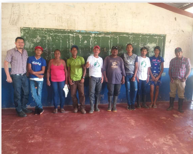
Ilustración 17. Líderes de comunidad de Moss

A este pesar, hay que añadirle ahora la salida de casi el 100% de ONG internacionales que operaban llevando ayuda humanitaria y promoviendo el desarrollo de estas comunidades, que solo hace que inyectar más pesar e incertidumbre sobre su futuro a una población que no para de ser golpeada, incluso por el propio Estado nicaragüense, que con esta decisión está condenando al retroceso en los procesos de desarrollo logrados en estos últimos años.