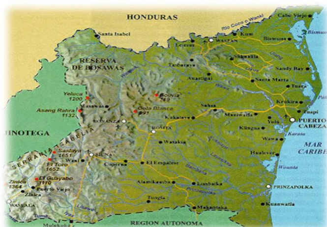
Ilustración 2. Mapa de Puerto Cabezas y Waspam

La principal actividad económica de la zona de intervención es la agricultura, para consumo del hogar y comercio de proximidad. Algunas familias tienen sus fincas lejos de la comunidad (algunos hasta 30 kms de distancia) distribuidas irregularmente tierras adentro. Algunas familias construyen casitas de palmas y ramas resistentes para quedarse en la finca y así dedicarse a la siembra por algunas semanas, mientras dura el ciclo productivo. Los cultivos principales son: arroz, frijoles, tubérculos y musáceas. En la mayoría de las comunidades crecen árboles frutales y también, se cultiva caña de azúcar y maíz en pequeñas