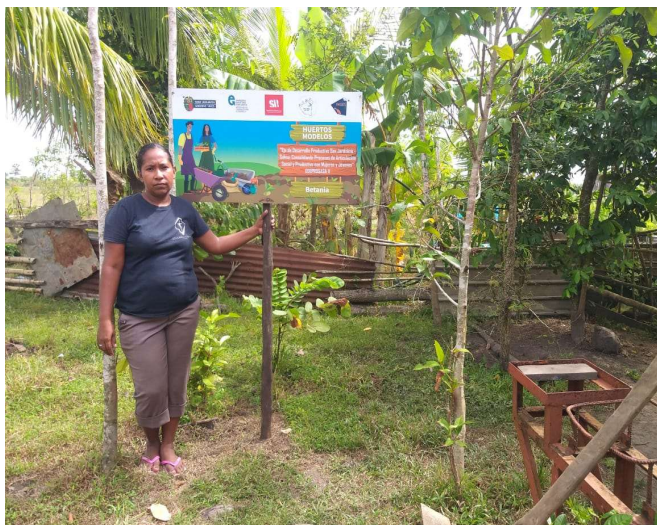
Ilustración 5. Mujer de comunidad Betania

El proyecto “Eje de Desarrollo Productivo San Jerónimo Sahsa: Consolidando Procesos de Articulación Social y Productiva con mujeres y jóvenes”, abordo la profunda inequidad de género que existe en las comunidades que integran su territorio de acción, que era una de las condiciones que más obstaculizaban sus posibilidades de desarrollo social y económico. Las mujeres de estas comunidades y también los jóvenes, están sometidos a una situación de subordinación cultural y social que les niega el derecho a los espacios de poder comunitario que están controlados por los hombres adultos, que no reconocen su rol productivo ni su derecho al acceso a los recursos naturales. En el caso de las mujeres a pesar de que su presencia es mayor que la de los hombres en términos