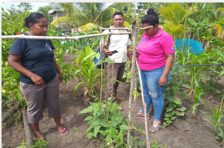
Ilustración 9. Mujer y su huerto en comunidad Betania

Lastimosamente, los territorios del pueblo misquito son una de las zonas más vulnerables al cambio climático, con afectación de desastres naturales que se suceden en cadena, uno tras otro, como son las inundaciones por torrenciales lluvias acaecidas entre los meses de septiembre y octubre; y huracanes tan potentes y destructivos como fueron el ETA e IOTA en noviembre de 2020, que inundaron completamente