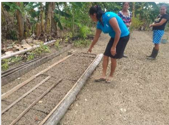
Ilustración 19. Mujeres retomando emprendimientos tras huracanes

Donde se ve menos participación es a nivel territorial, por la pérdida de confianza que la población expresa. Efectivamente, los gobiernos comunitarios y territoriales están siendo muy cuestionados por un sector importante de población. Se les acusa de no hacer lo suficiente por llevar el desarrollo a sus comunidades, de no invertir debidamente los recursos que se obtienen del Estado (siendo estos cada vez más reducidos) y de ser, (en algunos casos) cómplices en la cesión de usufructo de tierras a los colonos a cambio de cantidades económicas que quedan en sus manos. Otra de las razones para esta baja representación de jóvenes y mujeres en las estructuras de los Gobiernos Territoriales Indígenas (GTI) se debe fundamentalmente, a que en la actualidad los Gobiernos no se eligen de manera democrática, sino que están en manos de personas pertenecientes al partido del Gobierno que decide quien asume los cargos a favor de sus intereses.