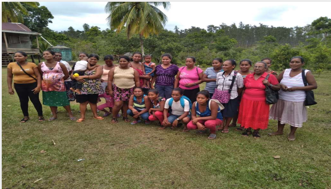
Ilustración 7. Mujeres de Francia Sirpi