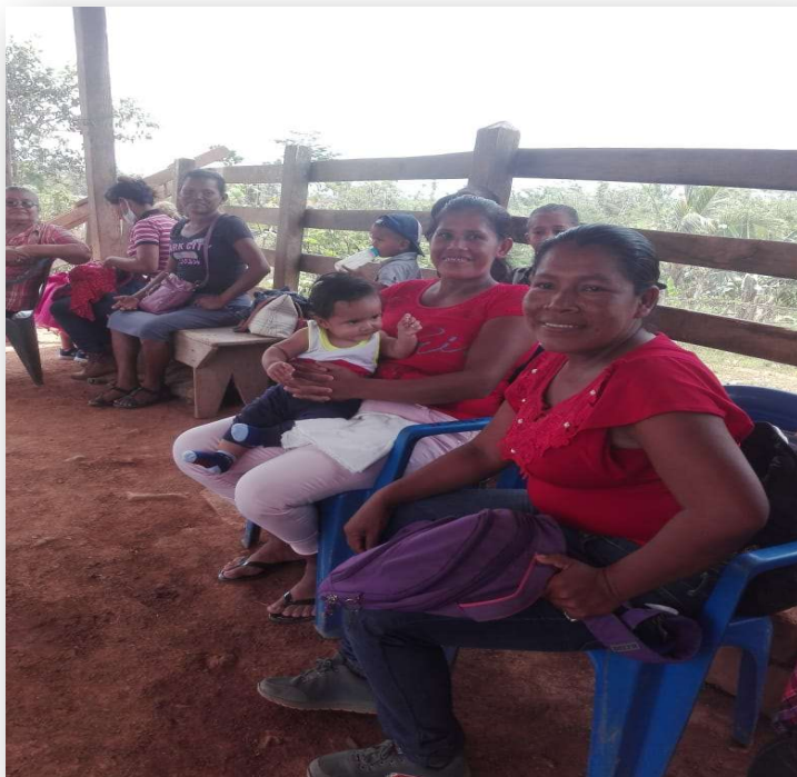
Ilustración 21. Mujeres participantes en grupo focal en Miguel Binkam

Efectivamente, hay avances en el ejercicio del derecho a la participación de las mujeres en la toma de decisiones comunitarias, lo que a su vez les permite abrir camino y generar mayores oportunidades para otras mujeres. Han aprendido a construir sus propios planes de acción y gestionarlos a nivel comunitario, lo que demuestra que están inmersas en un proceso de transformación individual y colectivo de su comportamiento sumiso y pasivo generado por el sistema patriarcal. Además, hay mujeres emprendedoras que tienen la capacidad de poder manejar su negocio propio (de lo que produce el huerto u otras iniciativas), lo