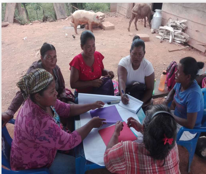
Ilustración 8. Mujeres líderes de Awastigne

La red de mujeres es un espacio organizativo de segundo nivel, que articula a las organizaciones comunitarias de mujeres impulsadas por el proyecto, de cada uno de los dos municipios concernidos. Sus integrantes, elegidas en cada comunidad, fueron capacitadas en aspectos legales y organizativos, de incidencia, auditoría social y planificación. Empezaron a tomar protagonismo con el aporte del proyecto antes de la pandemia, logrando elaborar, en un proceso de consulta participativa, su plan de trabajo, que lamentablemente no ha tenido mayores avances en su implementación desde la aparición de la pandemia, que según señalan las mujeres consultadas, no les ha