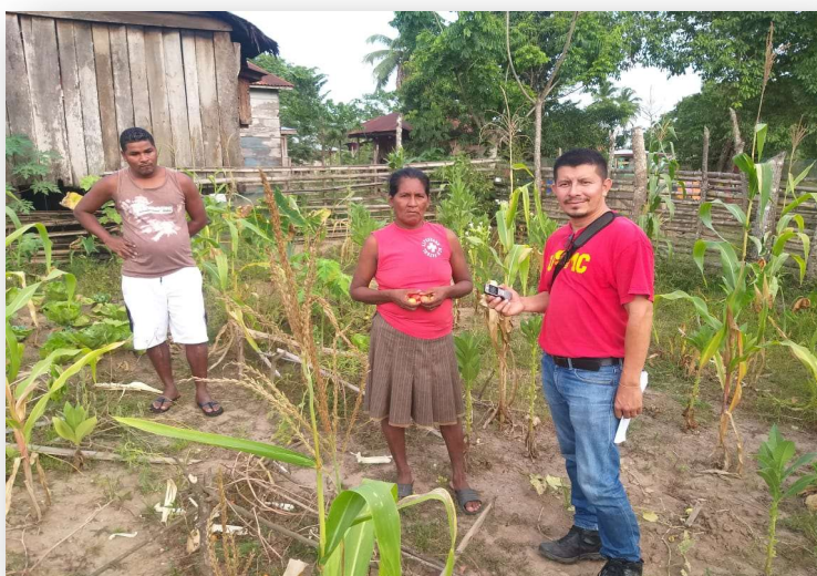
Ilustración 20. Mujer reactivando su huerto, tras el paso de dos huracanes

Testimonios así cuentan las participantes y demuestran que las acciones de empoderamiento económico han generado cambios en un importante número de mujeres en las comunidades, quienes han tenido acceso a participar en las capacitaciones, las que han ampliado sus capacidades, reforzado su autoestima y potenciado el desarrollo de su liderazgo, en igualdad de condiciones que los hombres. Esta estrategia de participación equitativa de las mujeres en los procesos de fortalecimiento de capacidades ha sido clave para que ellas tomen conciencia de sus propias capacidades y cuestionen los roles de género aceptados tradicionalmente en el pueblo misquito. Espacios como el CIDOC han abierto la posibilidad de que las mujeres jóvenes accedan a información actualizada, según se extrae de las consultas realizadas.