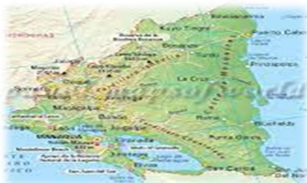
Ilustración 1. Mapa de Nicaragua

El contexto de Nicaragua se muestra sombrío debido a una crisis sociopolítica que hizo su estallido social en abril 2018. Las manifestaciones fueron violentamente reprimidas por las fuerzas oficialistas nicaragüenses. La Comisión Interamericana de Derechos Humanos cifra a 328 muertos luego de las protestas contra el gobierno de Daniel Ortega entre los cuales 24 son niños, niñas y adolescentes. Las organizaciones de la sociedad civil aumentan esta cifra hasta 600 fallecidos. El informe "Situación de los derechos humanos en Nicaragua" publicado en 2019 expone que al menos 88 mil Nicaragüenses migraron durante esta época, cifra que