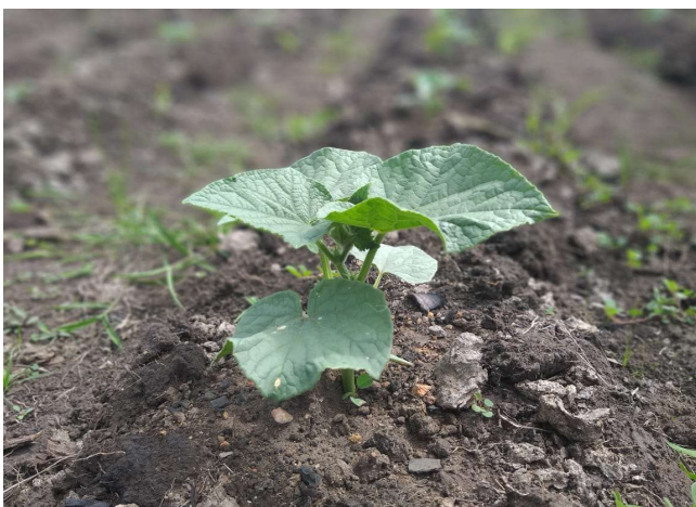
Ilustración 15. Planta que empieza a crecer en zonas reforestada

Este indicador fue uno de los que se notificó a la Agencia Vasca de Cooperación para el Desarrollo (AVCD) que no se alcanzaría por los efectos del huracán que prácticamente destruyeron todos los viveros que se habían instalado y que estaban a la espera del crecimiento al nivel adecuado de los plántones para ser sembrados, pero el agua de los dos huracanes que pasaron uno tras otro, inundaron completamente estas tierras arrasando con los viveros.