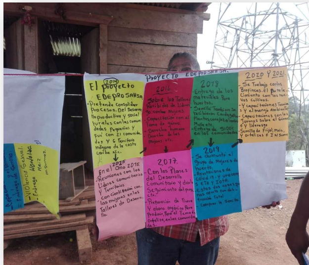
Ilustración 3. Grupo focal con mujeres de Moss