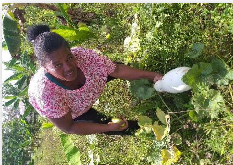
Ilustración 23. Mujer de Sisín, retomando sus cultivos en huerto

En el grupo de mujeres de Sahsa están desarrollando la línea de repostería, elaborando pasteles y otros productos que ofrecen a la comunidad, son el único proveedor de dichos productos, una de las mujeres del grupo expresó: “nosotras como grupo de mujeres pensamos continuar con el trabajo que venimos desarrollando, INGES nos ha apoyado con equipamiento básico para emprender y ahora nosotras estamos comprometidas para continuar, esto ya ha sido una base, nos capacitaron y nos dieron las herramientas básicas para trabajar, entonces ahora está en nuestras manos sostener este trabajo como mujeres trabajadoras con deseos de superación” .