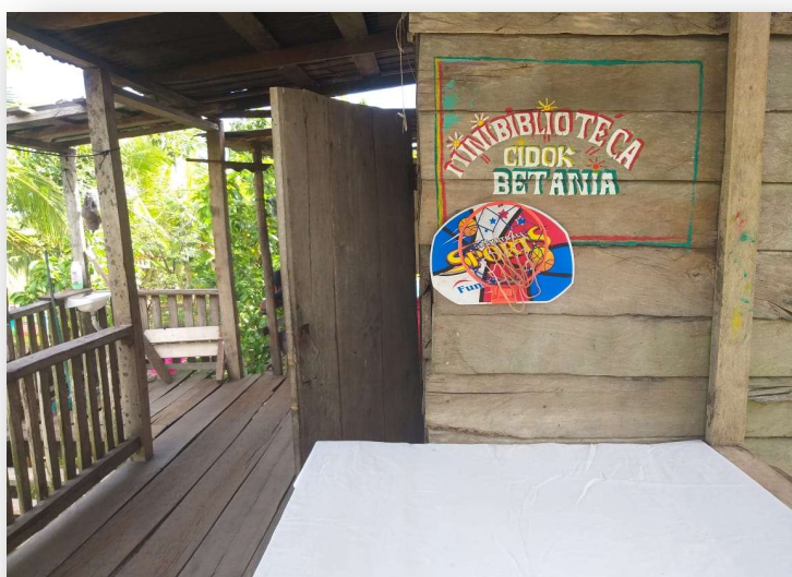
Ilustración 13. CIDOC visitado en comunidad Betania

18 CIDOC fueron instalados en las comunidades, los CIDOC cumplen un papel importante en la medida que son referentes de conocimiento en las comunidades a donde acuden sobre todo la niñez y adolescentes en edad escolar para tener fuentes de información que consultar. Ahora bien, con el convenio con la universidad URACCAN se buscó reforzar su función educativa y social con las actividades de extensión y observación de la Universidad de las Regiones Autónomas de la Costa Caribe Nicaragüense (URACCAN).