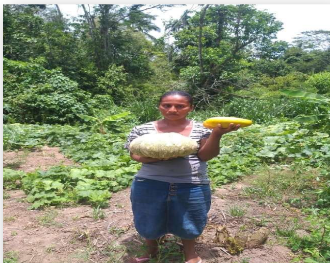
Ilustración 11. Mujer muestra producción de su huerto recuperado tras el paso de los huracanes con insumos del proyecto

En las visitas realizadas a los huertos logramos observar que la producción estaba en buenas condiciones de crecimiento, esto se da sobre todo en las comunidades de Sahsa, Sumubila, Betania, San Jerónimo, y Francia Sirpi. En el caso de las demás comunidades, debido al clima y sobre todo después de las afectaciones que dejó los huracanes ETA y IOTA, muchas personas lo perdieron todo, entre ellas sus huertos. Por otra parte, las temporadas de cosechas son variables para las verduras que cosechan las mujeres en sus huertos. En junio cuando se realizaron las visitas in situ de los huertos estaba iniciando el periodo de invierno, por lo que la sequía del verano era aún latente en las zonas de los llanos, por ello las cosechas se veían más productivas en la zona de montaña y en las riberas de los ríos como son en las comunidades de Betania y San Jerónimo, donde se apreció que las