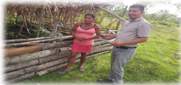
Ilustración 4. Visita a huertos de Moss