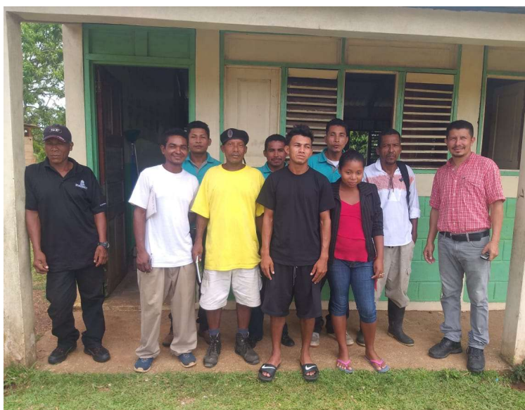
Ilustración 6. Líderes y jóvenes de comunidad Moss

En este sentido el proyecto ha sido altamente pertinente en abordar estas problemáticas sociales y barreras del sistema patriarcal, incentivando relaciones equitativas de género en los espacios comunitarios y la vinculación de mujeres y jóvenes con las organizaciones comunitarias. Además, no solo fue pertinente sino adecuado al contexto local y cultural del pueblo misquito que habita ancestralmente en estos territorios, integrando las diferencias culturales y adaptando su operativa a la dinámica local, con respeto y sensibilidad, lo que ha valido para que el liderazgo y la población de las comunidades se identifiquen con los procesos de desarrollo que la estrategia