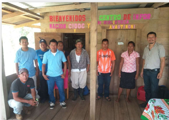
Ilustración 10. Gobierno Comunitario de Awastingni

El programa acompañó el proceso de conformación de las comisiones sectoriales que son responsables de gestionar y movilizar acciones para la implementación de los planes de desarrollo comunitario, logrando que los 18 Gobiernos Comunitarios las comisiones sectoriales comunitarias, las que fueron finalmente ratificadas, lo que representa un 100% de logro.