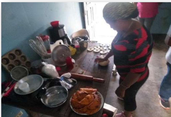
Ilustración 18. Mujer emprendedora de Santa Martha

consultados para la toma de decisiones en asuntos relacionados con el interés superior de las personas beneficiarias. En estas consultas expresaron abiertamente sus opiniones, dejando evidencias de los logros y los retos se presentan al concluir el proyecto.