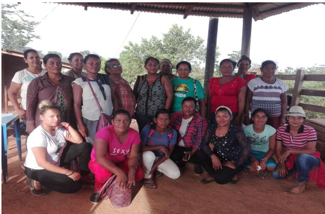
Ilustración 22. Mujeres de Miguel Binkam-Grupo focal de evaluación

Nicaragua está pasando por una crisis política, social, ambiental económica sin precedentes que afecta la sostenibilidad de los procesos que INGES y NE-SI han impulsado en los municipios de Puerto Cabezas y Waspam. La aparición de la pandemia terminó de dar la estocada final, aun así en la visita realizada con la evaluación a las comunidades meta, se pudo observar la gran capacidad de resiliencia social del pueblo misquito y esperanza que alberga el liderazgo consultado( ver foto de líderes).