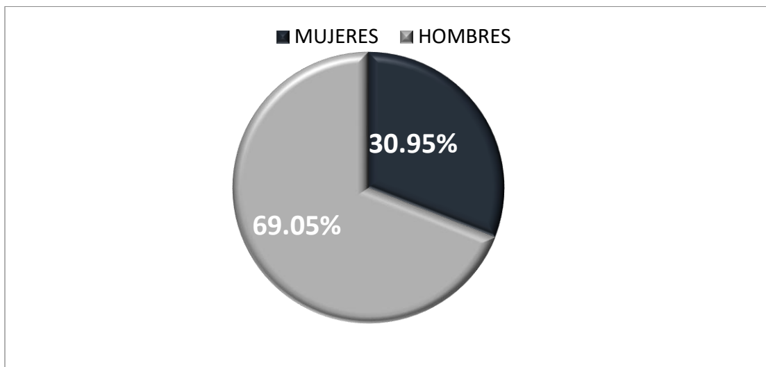
Gráfico 1: Porcentaje de diputados (as) propietarios (as) electos. Periodo 2018-2021

Como resultado de la aplicación de esta reforma, en las elecciones del año 2018 se logró obtener a nivel legislativo un 30.9% de diputadas propietarias (26 mujeres), sin embargo, en los gobiernos municipales, los incrementos de cuotas de mujeres se observan en las regidoras suplentes con 42.8% (TSE, 2018), siendo el porcentaje de mujeres alcaldesas muy bajo (29 de 262, lo que supone únicamente el 11.1%), 24.8% de síndicas y 30% de regidoras propietarias, la mayor parte de la representación de mujeres a nivel municipal se ubica en